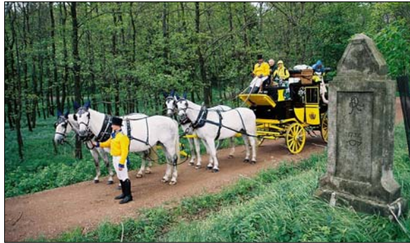
Viertelmeilenstein Liebenau (oben) Halbmeilensäule Grumbach (links) Ganzmeilensäule Göppersdorf (rechts) Distanzsäule Niemeck (unten)